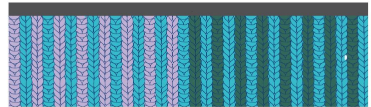
16 raitaa jokaista väriä lomittain. Kuvassa näkyy kaikki sivut. maalina Kivisil.