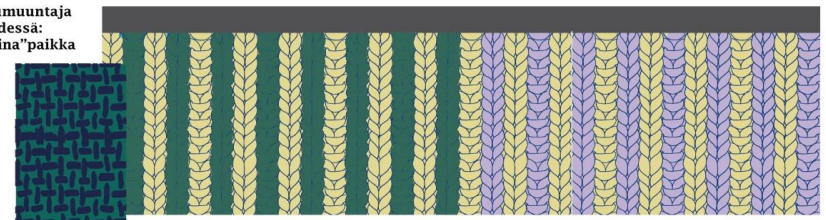
pikkumuuntaja edessä: "palttina"paikka